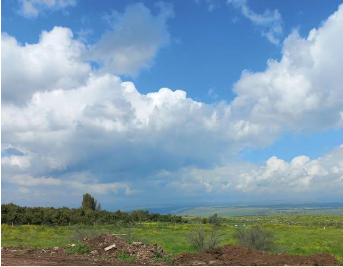
שתהא עלינו שבת של שלום