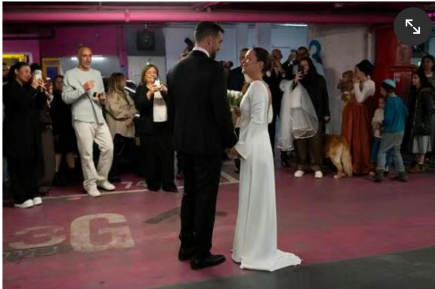
רק בישראל – חתונה בקומת מינוס 4 בדיזינגוף סנטר