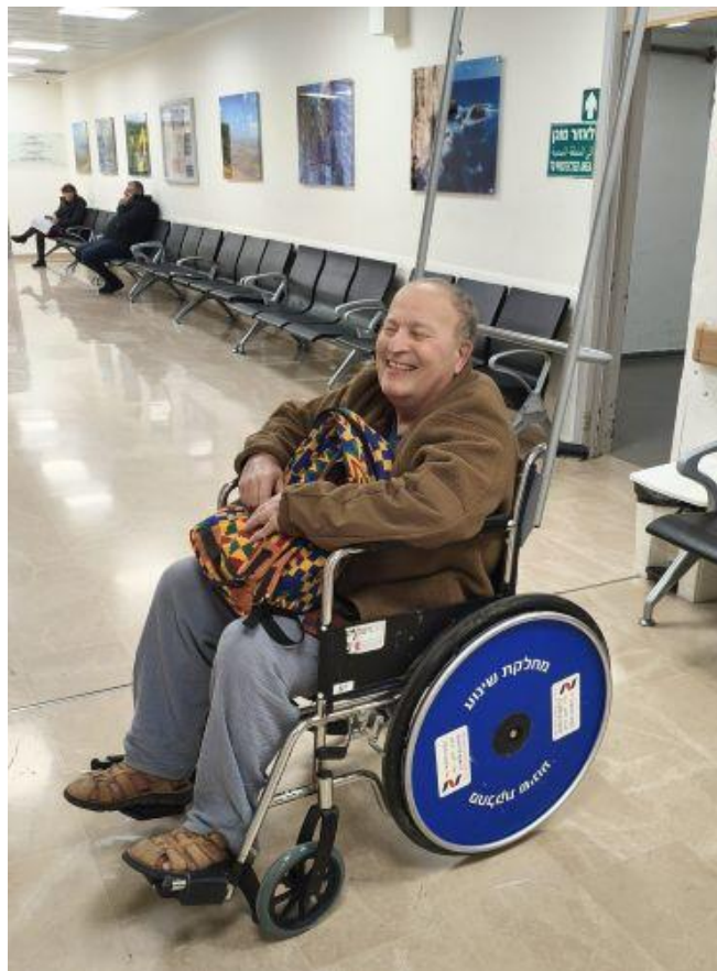
איזה אושר היה לי אירוע לבבי

6. בצילום אני נראה בכיסא גלגלים ממתין לצילום חזה. החיך בגלל שנמרוד אמר שניסיתי להימלט מבית חולים בכיסא גלגלים.